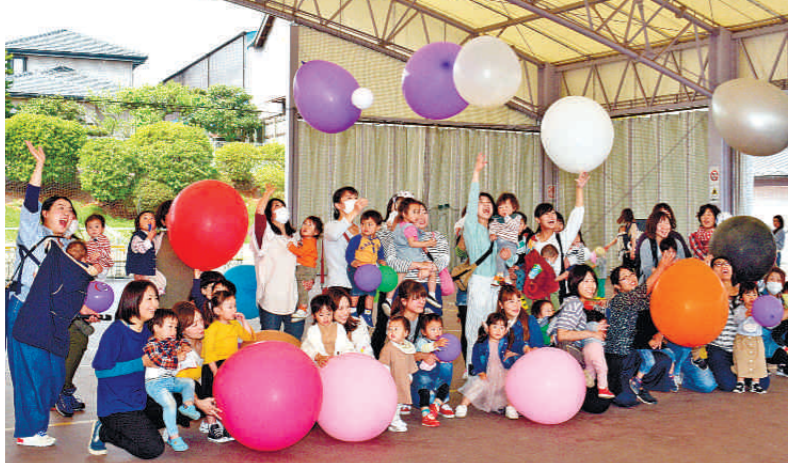
子育て支援サークルの下のWaiwardームも妻母親クラブ(石浜有紗会)ついで、「BIG風船で遊ぼう」は19日、下妻市下妻「ぼう」と題したイベントを開いた。会場に大きな風船で遊ぶ子どもたちの声が響き、その様子を守る母親たちの表情も笑顔にあふれた。催しには、就園前の子どもたち

新たな仲間を増やす同クラブの説明会を行った石浜会長(37)は「孤独な子育てにならないよう、外に出るきっかけをつくってほしい」と話した。(小林久隆)