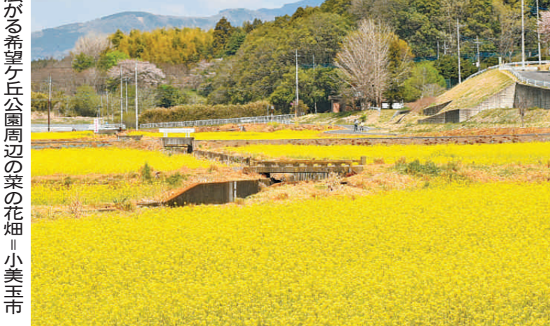
一面に広がる希望ヶ丘公園周辺の菜の花畑。小美玉市

子育て支援サークルの下のWaiwardームも妻母親クラブ(石浜有紗会)ついで、「BIG風船で遊ぼう」は19日、下妻市下妻「ぼう」と題したイベントを開いた。会場に大きな風船で遊ぶ子どもたちの声が響き、その様子を守る母親たちの表情も笑顔にあふれた。催しには、就園前の子どもたち