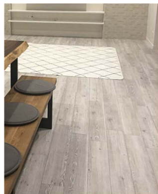
【床】 LDK、洋室（押入含む）、 ホール、物入、和室の間部のみ サンゲツ ビクルドエム WD-724