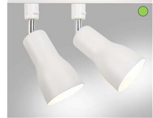
【照明】 ダクトレール + スポット トライト ホワイト色