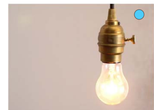
【照明】 ペンダントライト 真 鍮色