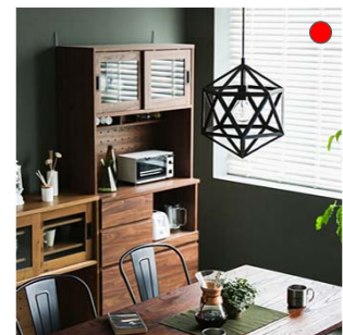
【照明】 Christa ブラック色