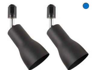
【照明】 ダクトレール + スポット トライト ブラック色