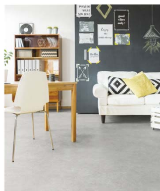
【床】 トイレ、洗面脱衣室