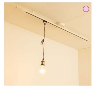
【照明】 ダクトレール + ペンダント トライト ブラック色