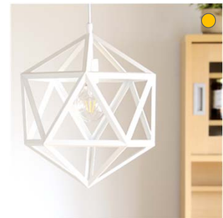
【照明】 Christa ホワイト色