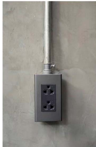
【床】 LDK柱部のコンセントは鋼製配管